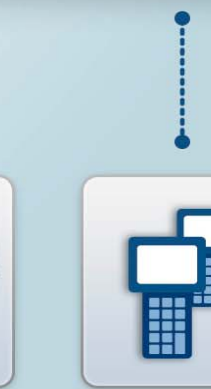
HAND HELD TERMINALS